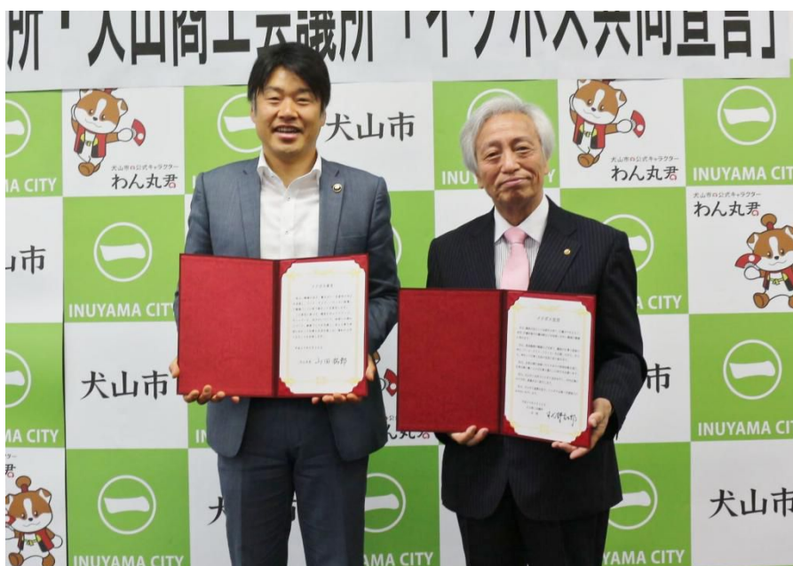
山田市長と日比野商工会議所会頭