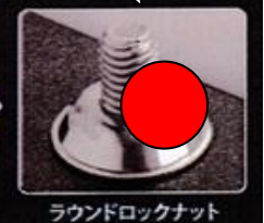
ラウンドロックナット