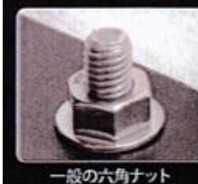
一般の六角ナット