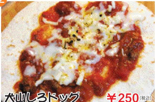
犬山しろドッグ ¥250 (税込)

名物しろバーガーと同じ超粗挽きミンチを使用した特性ソースと、ピザチーズを薄焼きトルティーヤで包んで鉄板で仕上げた、新感覚のドッグです。(写真は巻く前のものです)