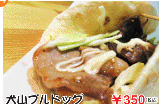
犬山ブルドッグ ¥350 (税込)

うす生地にブルコギ風ソースで炒めた豚肉とキャベツをまるめて、犬山だけにワンちゃん大好き骨のイメージ!!