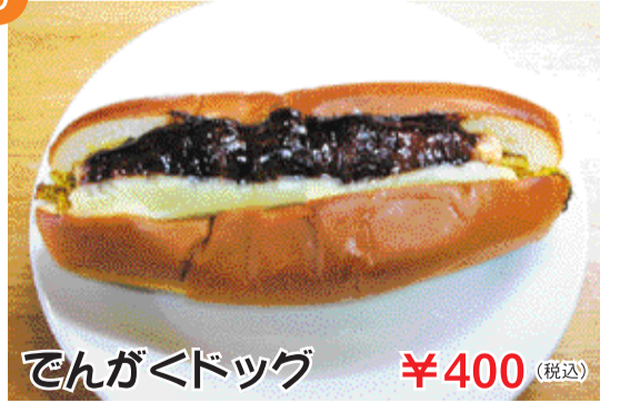
でんがくドッグ ¥400 (税込)

でんがく豆腐に肉を巻き、カレー味の千切りキャベツと共にパンではさんで自家製味噌をかけてあります。要予約!!