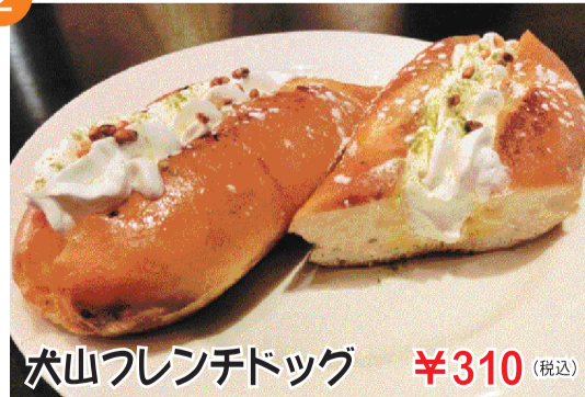
犬山フレンチドッグ ¥310 (税込)

ドッグタイプのフレンチトーストですホイップクリーム、抹茶、ローストした香り米をトッピングしたデザートです。