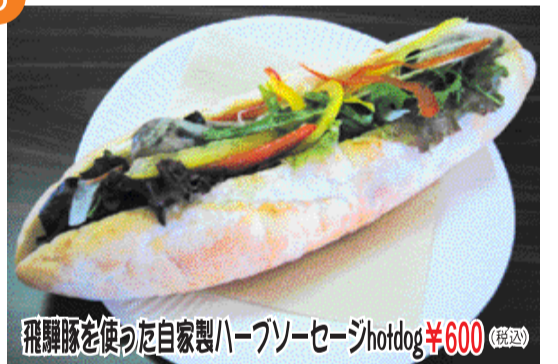
飛騨豚を使った自家製ハーブソーセージhotdog ¥600 (税込)

自家製ハーブソーセージを契約パン屋さんの特別なサンドバゲットにはさみました。自家製ドレッシングと新鮮な野菜が加わってボリューム満点!!