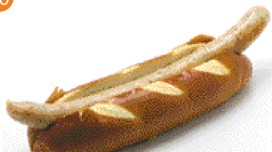
ブラードヴルスト ¥350 (税込)

ドイツパンに自家製の無添加ソーセージをさんだサイトの人気商品です。子供から年配の方、女性にも大変好評です。ドイツ国際コンテストでも高い評価を頂いたソーセージは、ドイツパンと相性ピッタリです!