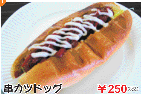
串カツドッグ ¥250 (税込)

自慢の手巻き串カツを使用したドッグです。バラ肉を1本1本手で巻き上げたカツですので、柔らかくジューシーにお召し上がり頂けます。