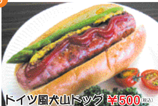
ドイツ風犬山ドッグ ¥500 (税込)

ソーセージとザワークラウト(キャベツの漬物)を挟んだドイツ風のドッグです。ビールとの相性は抜群です!!