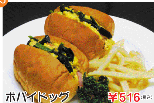
ポパイドッグ ¥516 (税込)

桃太郎とポパイの力強さをイメージし掛け合わせました。ベーコンと法蓮草を使用した玉子ドッグです。