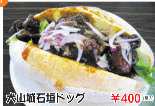
犬山城石垣ドッグ ¥400 (税込)

若鶏のから揚げを犬山城の石垣に見立て、甘酢で中華風に仕上げました。是非一度ご賞味あれ!!