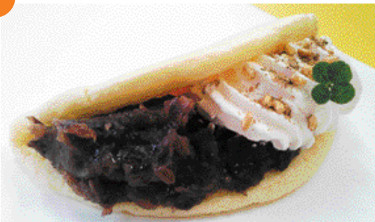
クローバードッグ ¥300 (税込)

犬山産の香り米の米粉を使ったパンケーキに、犬山産黒大豆のきな粉を使った黒蜜きな粉ドッグです!!