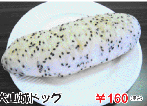
犬山城ドッグ ¥160 (税込)

犬山城と言えば白と黒。白パン黒ゴマの生地に黒ゴマあんとミルククリームを包んで焼きました。