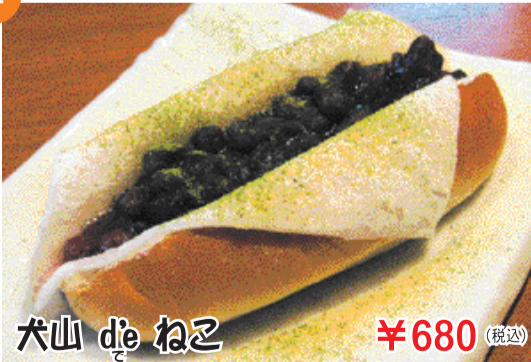
犬山 de ねこ ¥680 (税込)

どことなく懐かしい揚げパンと、犬山らしい古風なきな粉と抹茶のコラボレーション!!