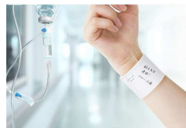
何度も書いて消せる！ 腕に巻き付けるメモ帳